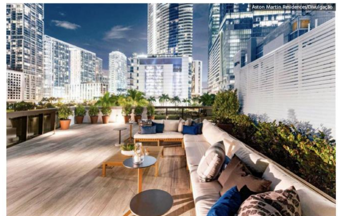
Panorama das residências no condomínio da Aston Martin

O DBX é incrivelmente veloz também, alimentado por um motor V8 de 4 litros duplo-turbo fornecido pela Mercedes-AMG, produzindo 542 cavalos de potência e 71 kgf·m de torque. O sistema é acompanhado de transmissão automática de nove velocidades, também produzido pela Mercedes.