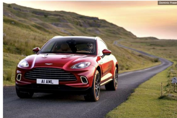
Aston Martin DBX

E o que é este novo supercarro com o misterioso apelido de três letras? O DBX é um SUV com alma e DNA de um carro esportivo, feito artesanalmente e tecnologicamente avançado. É a primeira aventura da empresa no reino das SUVs, caso você não acompanhe de perto essas coisas.