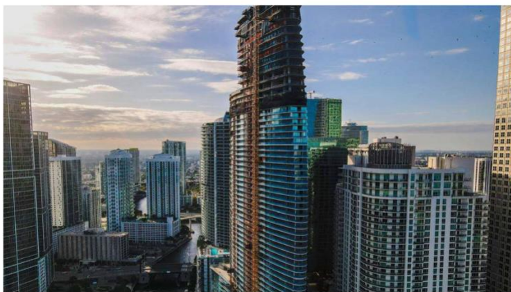
Aston Martin Residences, en el downtown de Miami, llegó a la cima ASTON MARTIN RESIDENCES

El fabricante del auto que usa James Bond alcanzó nuevas alturas con la culminación de su primera torre residencial en el downtown de Miami.