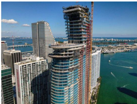
Aston Martin Residences está vendido casi en su totalidad. Aston Martin Residences

Las unidades van desde un condominio de dos habitaciones y dos baños y medio de unos 1,100 pies cuadrados por aproximadamente $2 millones, hasta una unidad de cuatro habitaciones y cuatro baños y medio de 3,300 pies cuadrados y cuesta unos $4 millones. Además de las llaves de su nuevo departamento, los compradores recibirán un SUV Aston Martin, valorado en unos $176,900, o un Aston Martin DB11 de 2020 de $250,600.